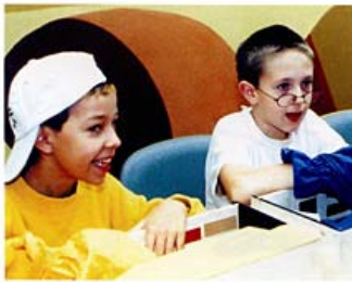
Begeisterte Kinder lernen Verständnis.

dem Erhalt der Lebensqualität liefern. Inhalte der Vortragsreihe, aber auch die Erstellung verschiedener Broschüren oder Trainingskonzepte ergeben sich einerseits aus dem Aufgreifen von angst- und tabubesetzten