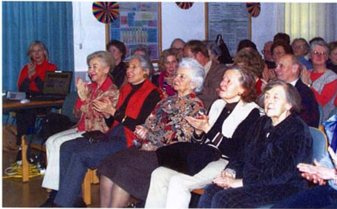
Senioren entdecken, dass man auch Altwerden lernen kann.

Dieser Gedanke hat ausgehend von der Landesklinik für Geriatrie Salzburg im Jahre 2002 zur Gründung des Vereins „Ein Schritt ins Alter“ und im Weiter-